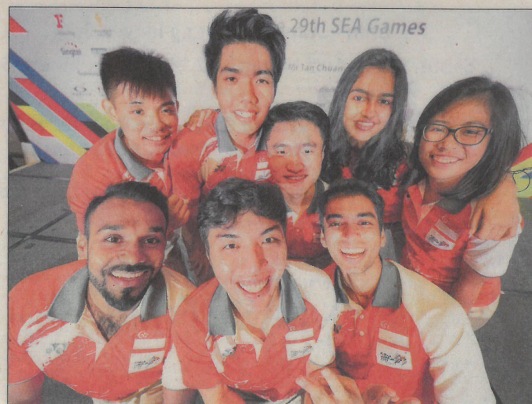
'BERWEFIE' BERSAMA: Pasukan squash juga mencatatkan kejayaan cemerlang di Sukan SEA KL.