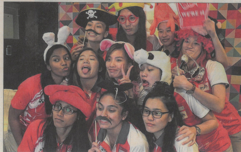
SUASANA MERIAH: Pasukan bola jaring negara, yang membawa pulang pingat perak dari KL, turut menyeronokkan majlis anugerah.